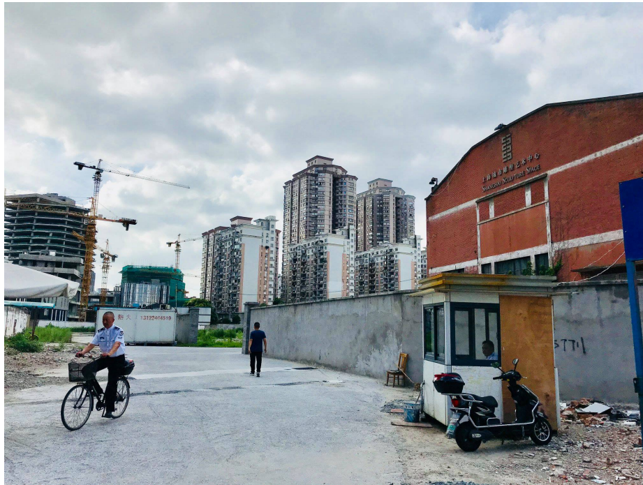
已拆遷的長寧區淮海西路原址

這次參觀的展覽「融合視界：亞歐經典版畫展」談從明清版畫如何影響日本浮世繪，而日本浮世繪又如何影響歐洲的銅版畫。明清版畫跟日本浮世繪的展品頗精彩，但是歐洲銅版畫的部分就遜色許多。