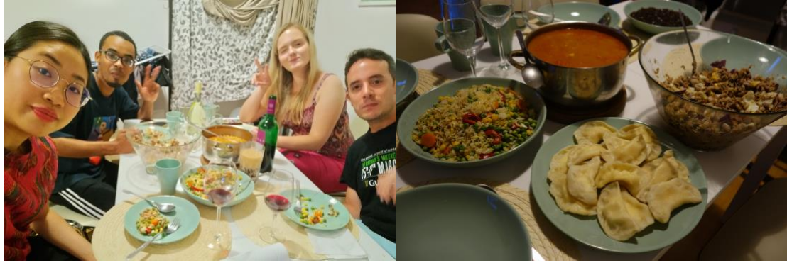
於布達佩斯的餐會