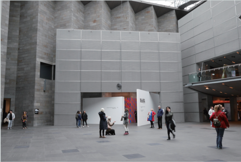
National Gallery of Victoria, Melbourne 在意料之外也是意料之內的參關該國最古老的公立美術館，而湊巧碰上從公車上廣告得知的當期MOMA展覽，觀看真實存在於眼前的所有作品，所有從印刷品上頻繁出現的作品真實存在於眼前，我想，這是所有人的夢想了。