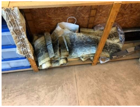
已經處理好的蛇皮

心中突然頓悟，以前怎麼都沒想過，台灣的傳統樂器也可以讓觀光客體驗，這樣就能讓更多人認識，也不會讓這些可貴的樂器繼續默默無名。