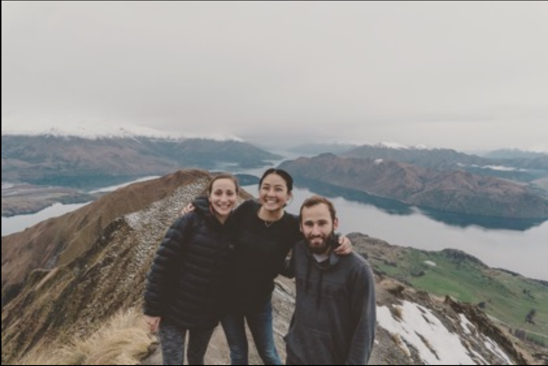
@ Roy's Peak in Wanaka

Wanaka 是所有我們經過的南島城鎮裡最為喜愛的一處。這裡離人群嘈雜的 Queenstown 只有一小時的車程，卻充滿著一種自己富有生命力的沈靜。在這裡我們一同經歷了一趟令人難忘的五小時登山，眼看我們的車子從一台四人座轎車到頂峰時他只是一個小小的白點，停在那裡，世界對我們來說好抽離，反倒是大山大湖將你緊緊擁抱。過程中實在煎熬，幾乎無一處平坦的路段，陡峭的山壁其實讓我們爬得都很不舒服，但是我們告訴彼此都經過了大半個地球來到這裡，相信自己，慢慢走就好，慢慢走比較快。