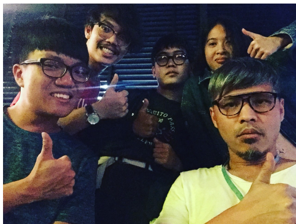
第一天來到公司，與主管、員工晚餐後的合影