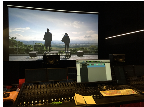
把自己的畢業作品帶到公司放映討論