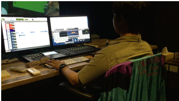
觀摩音效師製作音效