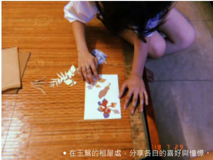
◆ 在玉鴛的租屋處，分享各自的喜好與憧憬。