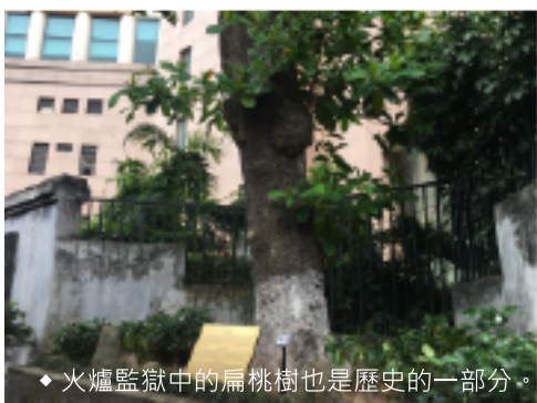
◆ 火爐監獄中的扁桃樹也是歷史的一部分。

在臺灣當代藝術中，近年廣泛討論原民性，此行我也想了解在越南的五十多個少數民族，民族學博物館室內空間本身為半圓環狀，展示了各民族服飾、農具與技藝、建築等，就連儀式也以場景布置的方式輔以動態影像呈現出來，除此之外還設有南亞博物館，蒐羅範圍擴出越南，資料相當豐富，一整天對著古物驚呼非常過癮。戶外展區還原了傳統住屋，甚至能走進去參觀讓我很驚喜，這與觀看玻璃櫥窗裡的展品非常不同，跟隨著導覽機，我得以攀爬木梯撫摸竹材，嗅聞酒甕，將身體經驗飽滿。