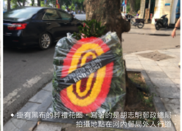
◆ 掛有黑布的葬禮花圈。寫著的是胡志明郵政總局，拍攝地點在河內郵局外人行道。