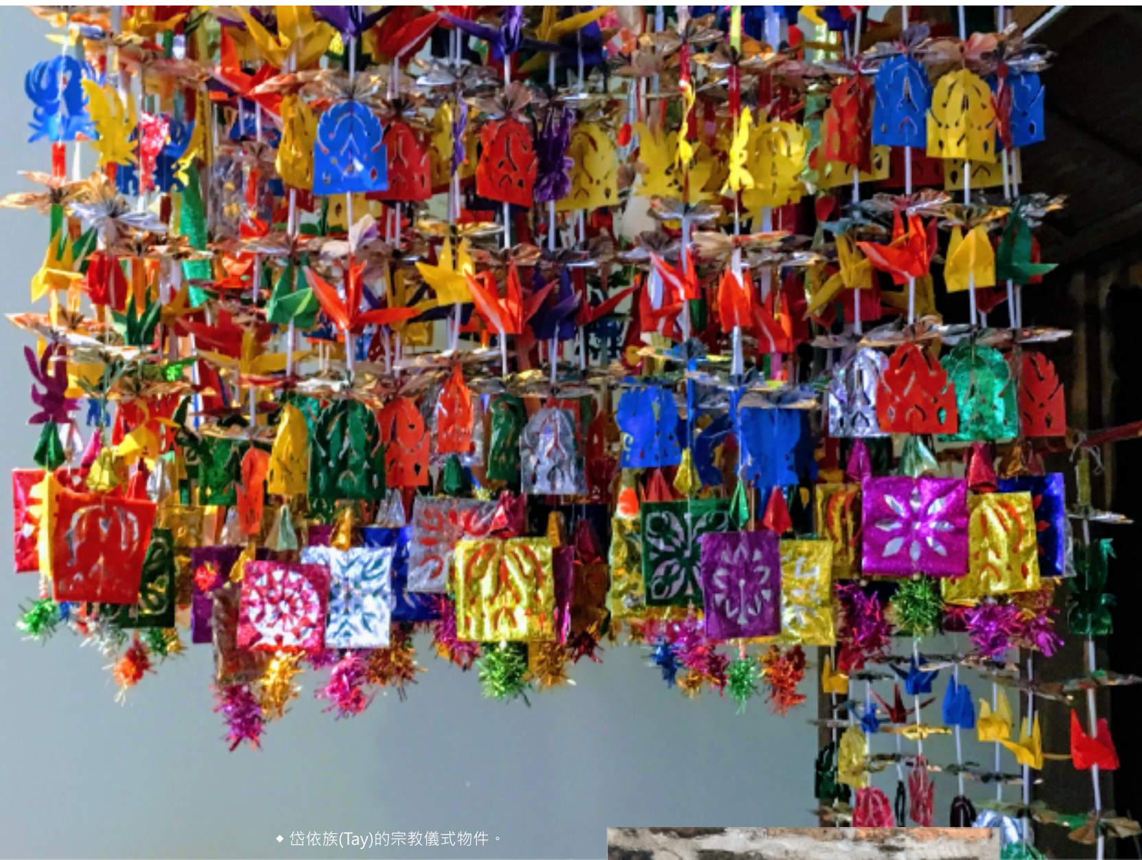
◆ 岱依族(Tay)的宗教儀式物件。