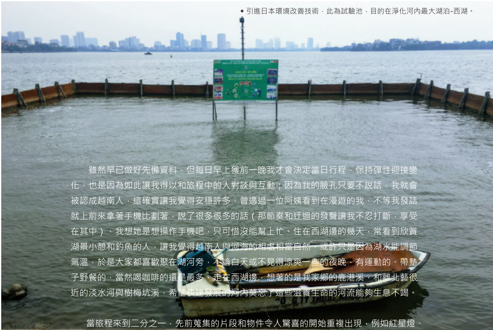
◆ 引進日本環境改善技術，此為試驗池，目的在淨化河內最大湖泊-西湖。

雖然早已做好先備資料，但每日早上獲前一晚我才会決定當日行程，保持彈性迎接變化，也是因為如此讓我得以和旅程中的人對談與互動；因為我的臉孔只要不說話，我就會被認成越南人，這確實讓我覺得安穩許多，曾遇過一位阿姨看到在漫遊的我，不等我發話就上前來拿著手機比劃著，說了很多很多的話（那節奏和迂迴的發聲讓我不忍打斷，享受在其中），我想她是想操作手機吧，只可惜沒能幫上忙。住在西湖邊的幾天，常看到欣賞湖景小憩和釣魚的人，讓我覺得越南人與河海的相處相當自然，或許只是因為湖水能調節氣溫，於是大家都喜歡聚在湖河旁，不論白天或不見得涼爽一些的夜晚，有運動的、帶墊子野餐的，當然喝咖啡的還是最多，走在西湖邊，想著的是我家鄉的鹿港溪，和離北藝很近的淡水河與樹梅坑溪，希望快速發展的河內莫忘了這些滋養生命的河流能夠生息不竭。