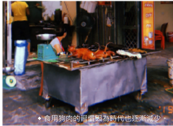
◆ 食用狗肉的習慣因為時代也逐漸減少。