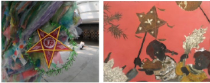
漆畫：拿著五星花燈嬉鬧的兒童， 越南中秋節是屬於兒童的節日。

作為共產主義象徵的紅色五星，體現在信仰與節慶中，那些不斷出現的五星形，已然成為符號，注意到五星燈是中秋節的孩童玩具，詢問之下才了解越南中秋節有著截然不同的阿貴奔月和農閒時節陪伴小孩的意義，在漢文化影響下，去觀察在地人因時制宜在其上發展出的不同變化是很有趣的。還有我最喜歡了解人如何使用植物，就像是冷熱皆可隨興沖出來讓路經的人解渴的冰茶(trà đá)文化(有些像臺灣早期的奉茶)；跟著去菜市場的時候買的一袋未開的花，是在越南很普遍入菜也會用來祭祀的夜來香(hoa huệ)，這和我所知歌頌其優雅神秘的形象有很大不同。