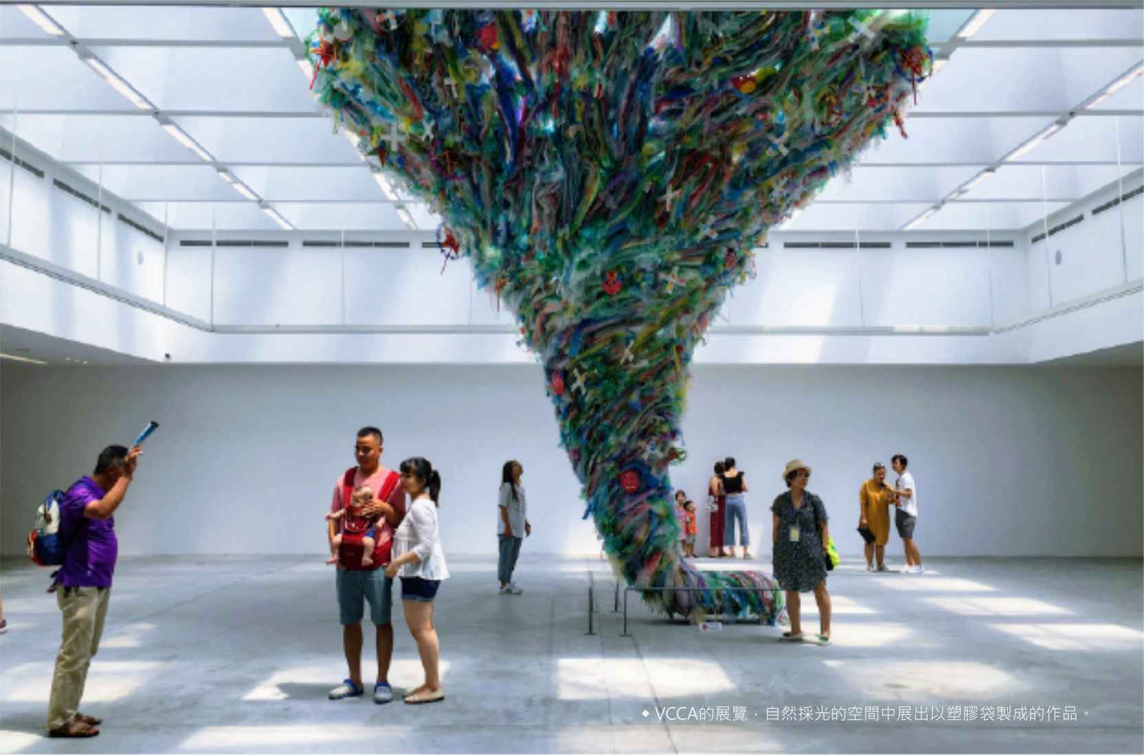
◆ VCCA的展覽，自然採光的空間中展出以塑膠袋製成的作品。