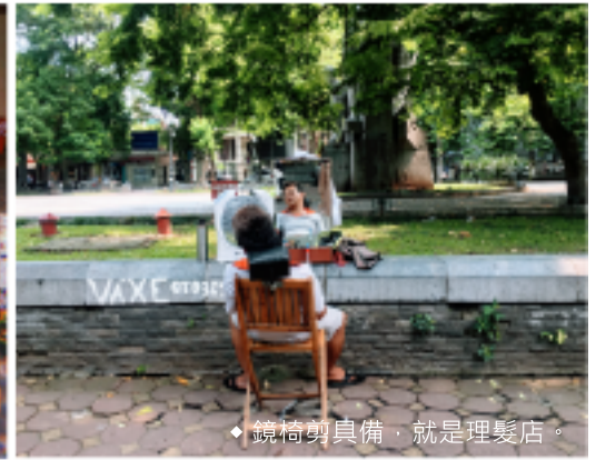
◆ 鏡椅剪具備，就是理髮店。