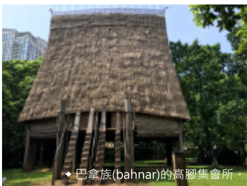
◆ 巴拿族(bahnar)的高腳集會所。