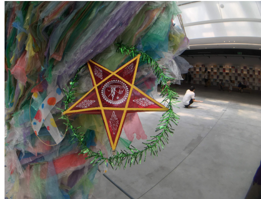
裝置藝術作品局部 · 攝於河內當代藝術中心 (VCCA)