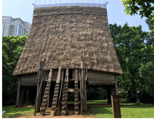
巴拿族 (bahnar) 的高腳屋集會所，越南有五十多個少數民族，普遍認知的越南人是人口數佔八成的京族。