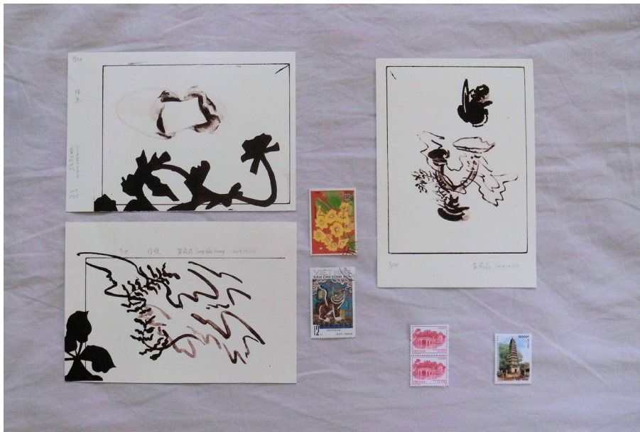
版畫作品與在河內收集的郵票，攝於巴亭郡的民宿。