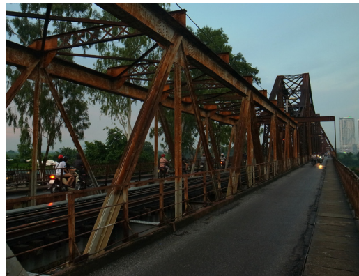
Cầu Long Biên (龍編橋) · 1902年完工 · 橋長1862米 · 中間部份只給火車行駛。兩旁是給機車及行人走的。