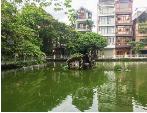
52 Hàng Bò 越戰期間墜毀在湖中的戰鬥機。