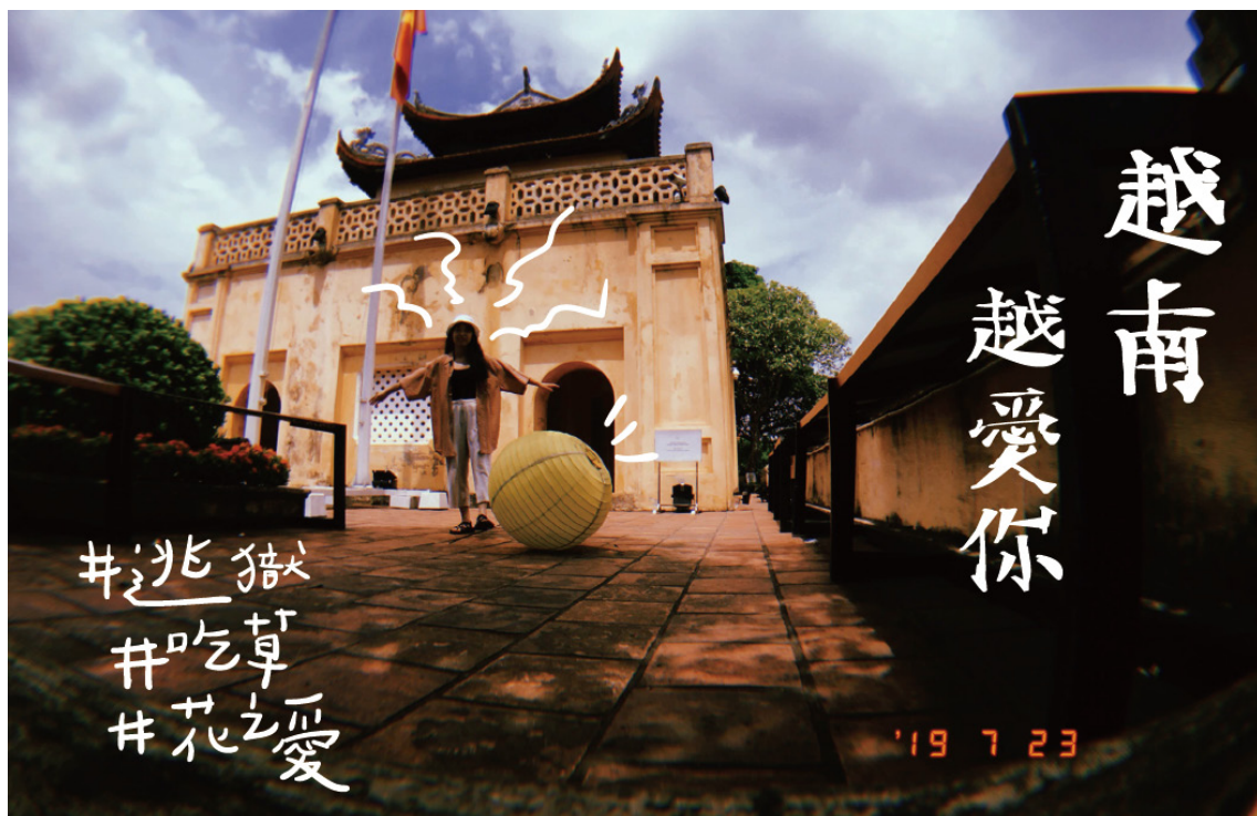
昇龍皇城與掉落的大燈籠。11 世紀越南李朝所建，後來陳朝及黎朝陸續擴建，其皇城象徵越南脫離古代中國統治並建立具越南特色的獨立王朝，並於 2010 年獲 UNESCO 世界遺產。