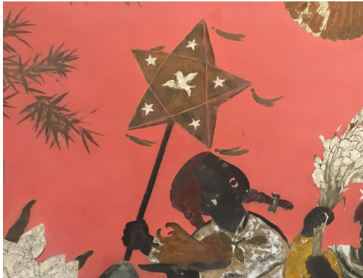
Hoàng Tích Chù <Uncle Hồ Plays with Children> · 1960 · 漆畫 · 作品局部 ·

作為共產主義象徵的紅色五星，體現在信仰與節慶中，那些不斷出現的五星形，已然成為符號，注意到五星燈是中秋節的孩童玩具，詢問之下才了解越南中秋節有著截然不同的阿貴奔月和農閒時節陪伴小孩的意義，在漢文化影響下，去觀察在地人因時制宜在其上發展出的不同變化是很有趣的。我最喜歡了解人如何使用植物，就像是冷熱皆可隨興沖出來讓路經的人解渴的冰茶 (trà đá) 文化 (有些像臺灣早期的奉茶)；跟著去菜市場的時候買的一袋未開的花，是在越南很普遍入菜也會用來祭祀的夜來香 (hoa huệ)，這和我所知歌頌其優雅神秘的形象有很大不同。