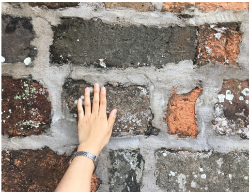
文廟的磚頭非常厚，深灰色磚來自被法國人摧毀的黎朝昇龍皇城，紅磚則來自阮朝。