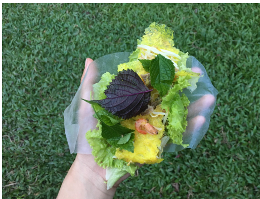
在國子監花園後捲海鮮煎餅，紫蘇、生菜和越南薄荷讓口味更清爽。

回到臺灣我整理著收集來的資料，爬梳彼此的連結準備撰文在網路上分享，恰好也遇到東南亞書主題書店的越南史講座，能從另一視角聽越南的故事，忘了帶買好的書過去捐贈讓我有藉口再去拜訪，我想做關於這趟旅程的作品，和在河內認識的朋友們或是任何有興趣的人分享。