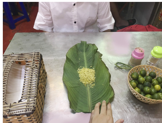
朋友帶給我的零嘴，未完全成熟的米粒烘烤而成，再用香蕉葉包裹，吃起來些微硬，嚼起來有米香。