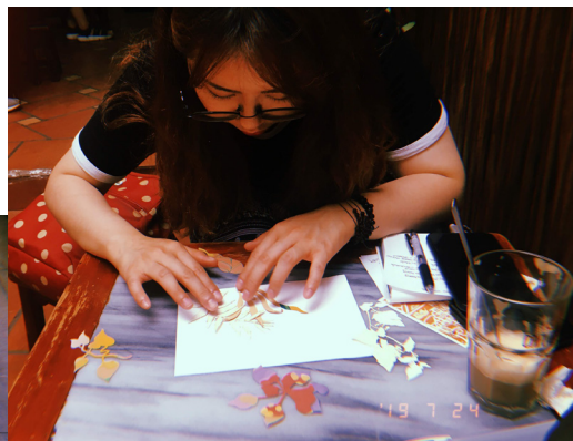
也許像拼圖、安穩擺放又或者連接某個情緒的時刻。