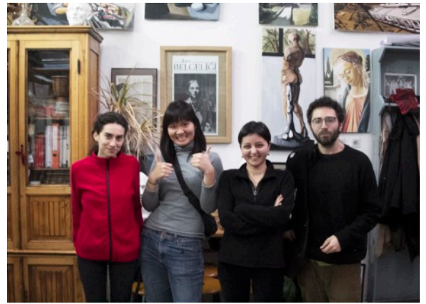
參觀 Marmara Üniversitesi

在這些交流的過程中，讓我更了解當地藝術工作者所追求以及執行的目標，也能或多或少感受到彼此間的差異跟可以學習的方向。