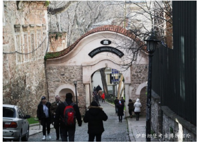
伊斯坦堡考古博物館外