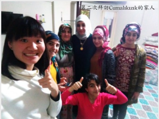
第二次拜訪Cumalikızık的家人