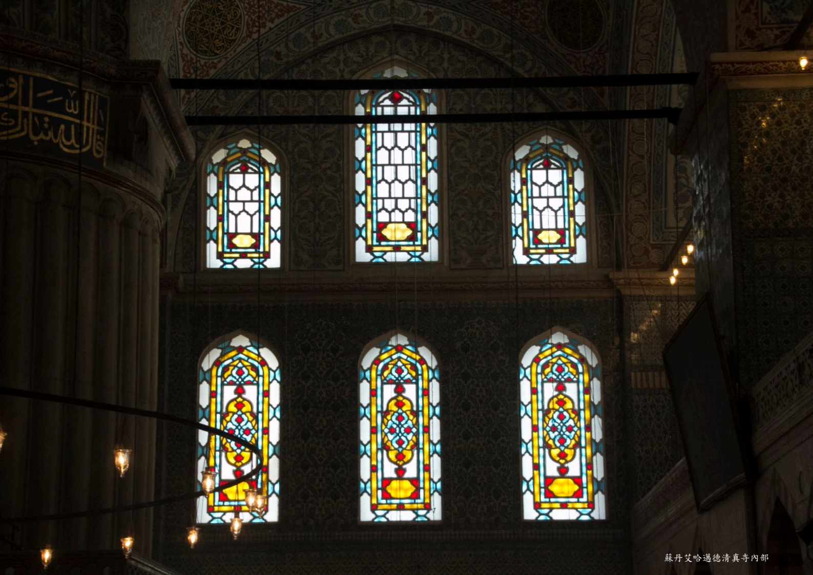
蘇丹艾哈邁德清真寺內部