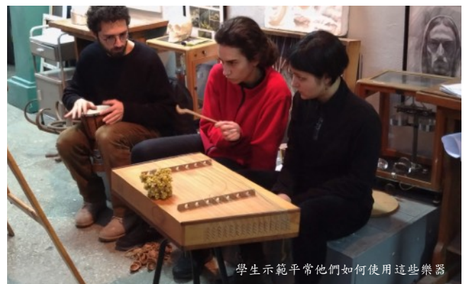
學生示範平常他們如何使用這些樂器