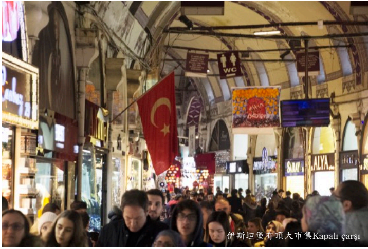
伊斯坦堡有頂大市集Kapalı çarşı