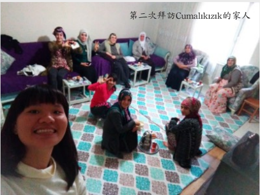
第二次拜訪Cumalikızık的家人