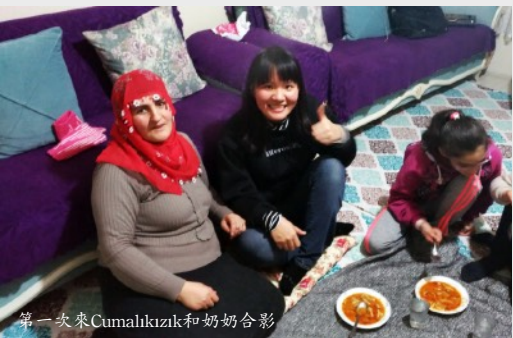
第一次來Cumalikızık和奶奶合影

此外有一個我特別想介紹的家庭，是我在布爾薩一個叫Cumalikızık的村莊偶然遇到的，這個地方似乎不太常有外來旅客，是個非常純樸的地方，路上的人都一邊看著我對我微笑，小朋友還會主動和我打招呼並用土耳其語問我是哪裡人，開車經過的人各個都瞪大眼睛望向我，還以為他們開的是動物園遊園車。