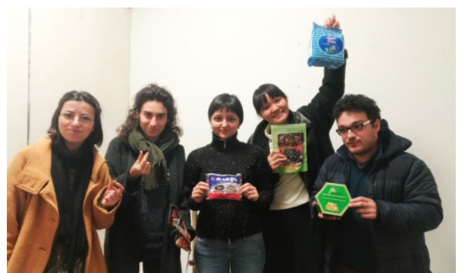
我帶來了台灣的泡麵，當地人也送我一盒土耳其軟糖