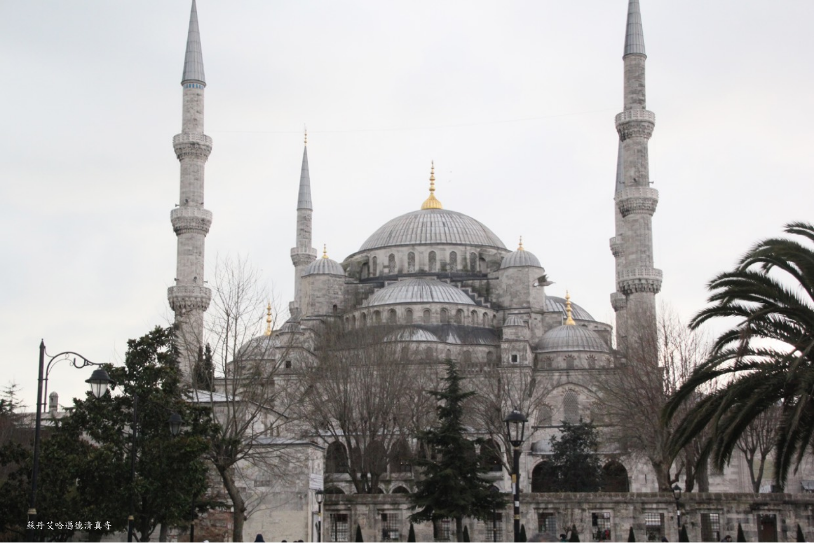
蘇丹艾哈邁德清真寺