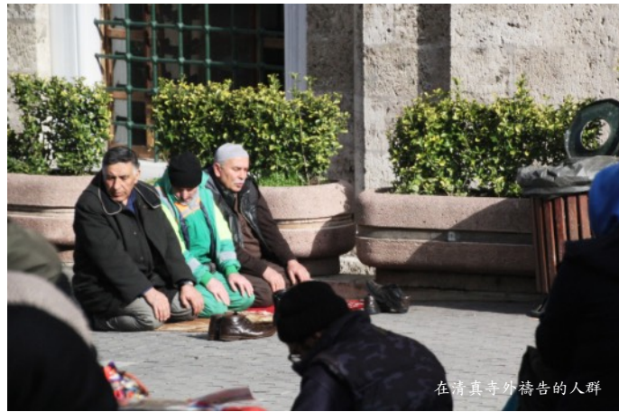
在清真寺外禱告的人群